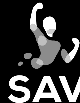
wersja monochromatyczna na ciemnym tle