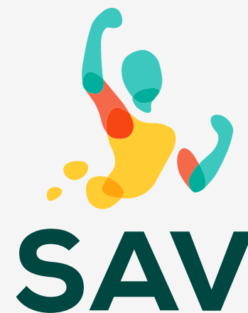
wersja kolorowa na jasnym tle

Prostokąty opisujące znaki nie stanowią integralnej części znaku – symulują jedynie tło. Dostępne formaty: .ai, .eps, .pdf.