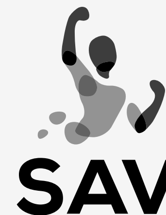
wersja monochromatyczna na jasnym tle